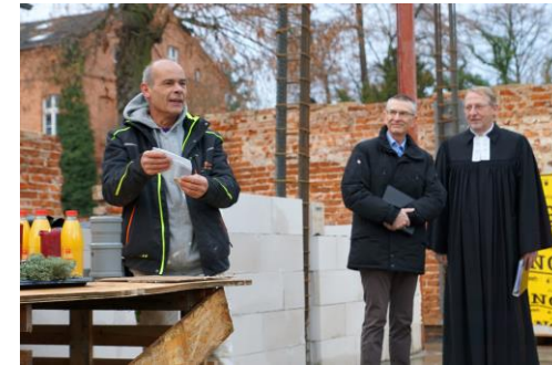
Foto: Grundsteinlegung zum Neubau des Gemeindehauses am 17. 12. 2019